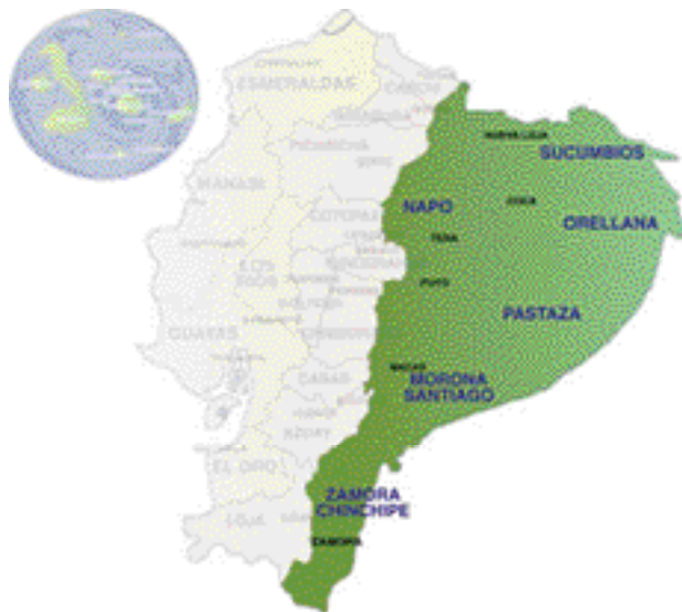
Figura 04 - Mapa de la Región Amazónica.