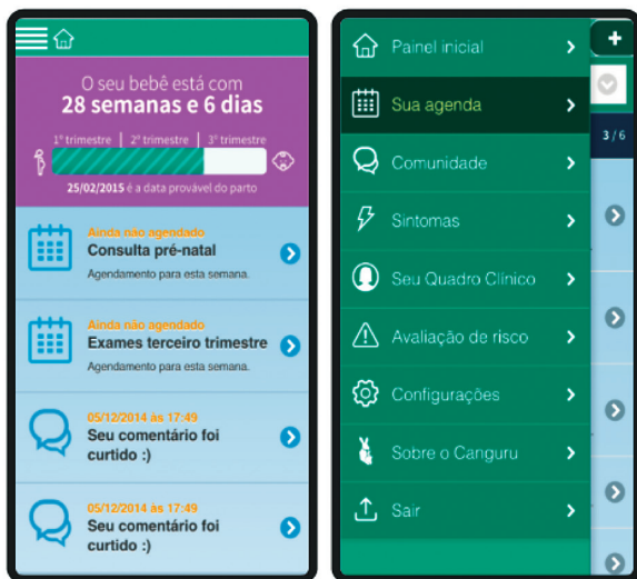
Figura 1 - Pantalla inicial.

Las versiones Pro y Gestor todavía se encuentran en la fase de prueba y se espera que estén disponibles en el mercado en 2016.