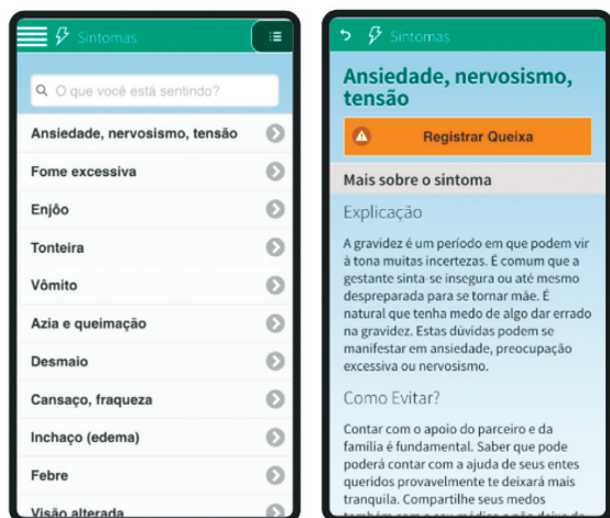
Figura 4 - Síntomas.