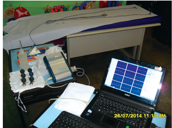
Figura 2 - Equipos montados para los exámenes de ECG en una unidad de salud.

examen. Como la anamnesis y el examen se realizaban en sitios distintos, fue posible hacer de 10 a 12 exámenes por hora (Figuras 2 y 3).